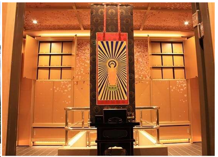
納骨堂内部正面【焼香及び礼拝施設】