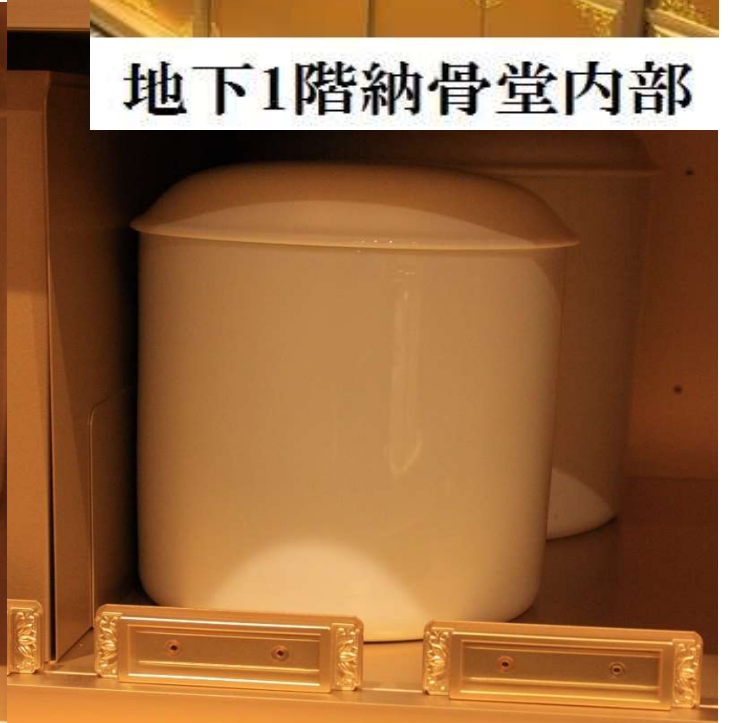
ロッカー内部納骨例【ご夫婦でご利用の場合:5寸・7寸収納】