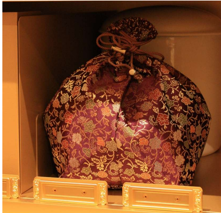
納骨袋に移し替えた場合、3体~4体収納可能