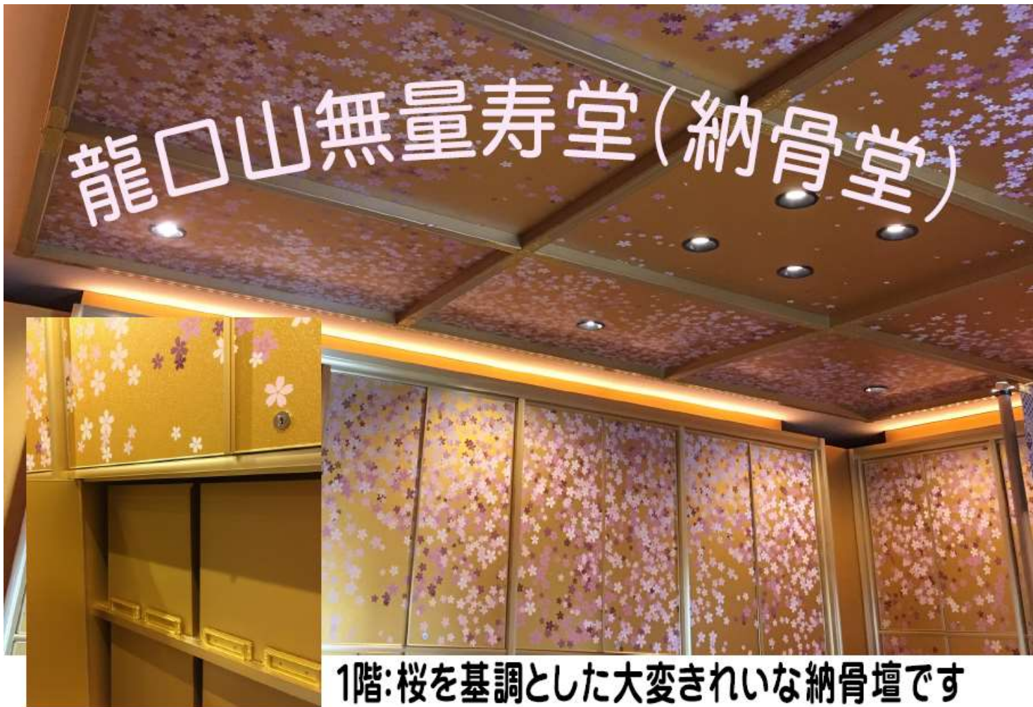
1階:桜を基調とした大変きれいな納骨壇です