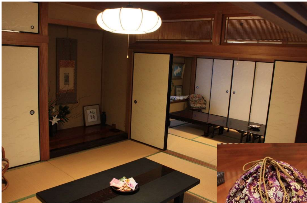
和室【待合・会食等はこちらをご利用ください】