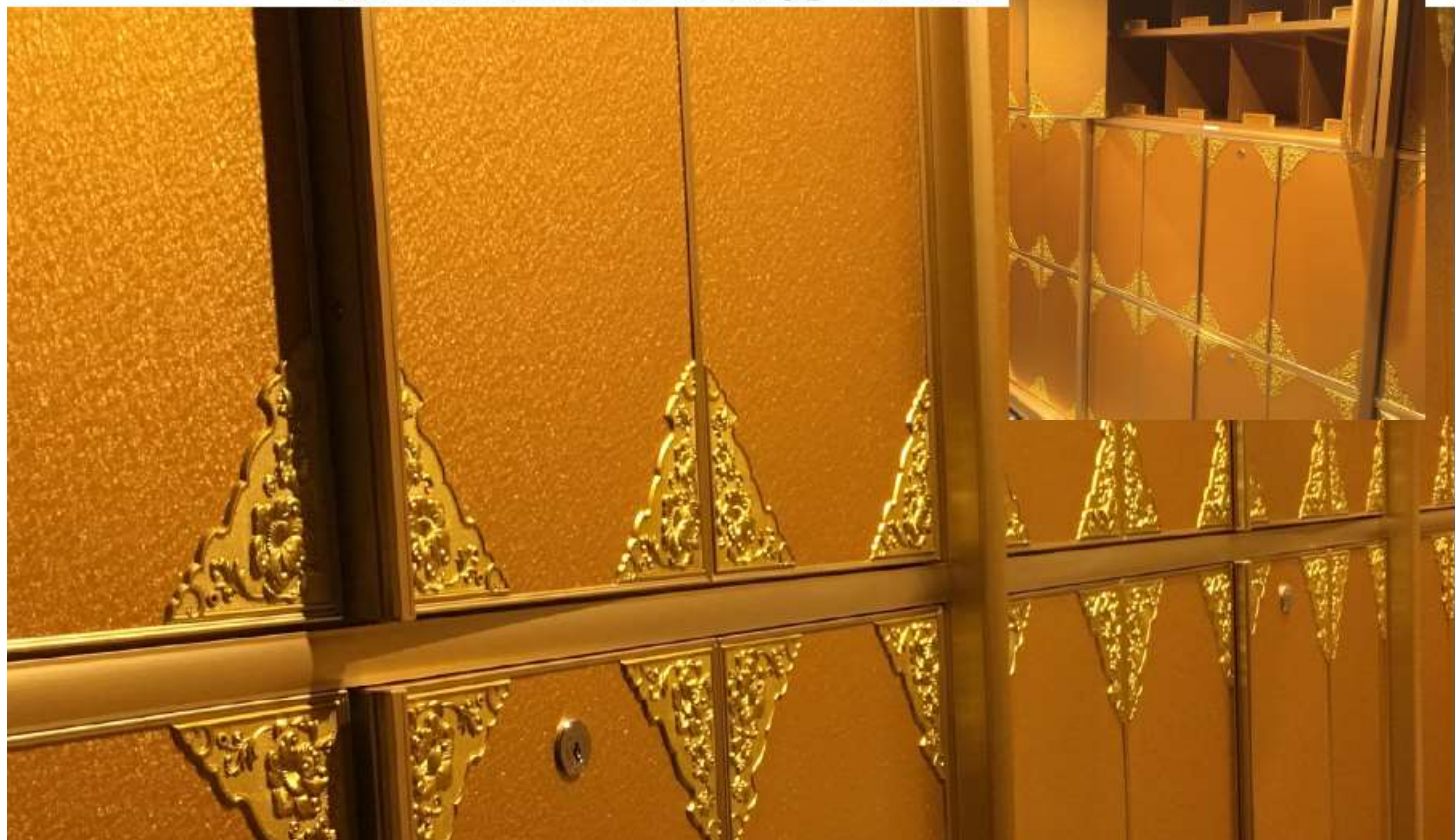
地下:ゴールドを基調とした 落ち着いた納骨壇です