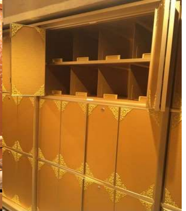
地下1階納骨堂内部