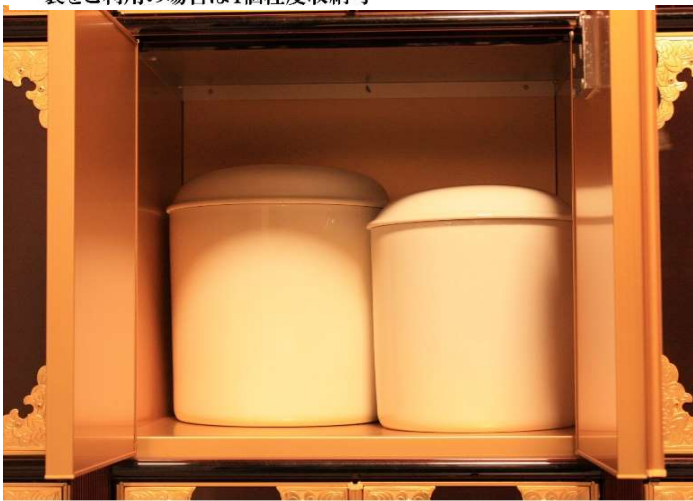
5寸・7寸収納例【副葬品など収納可】