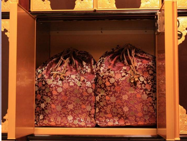
袋をご利用の場合は4個程度収納可