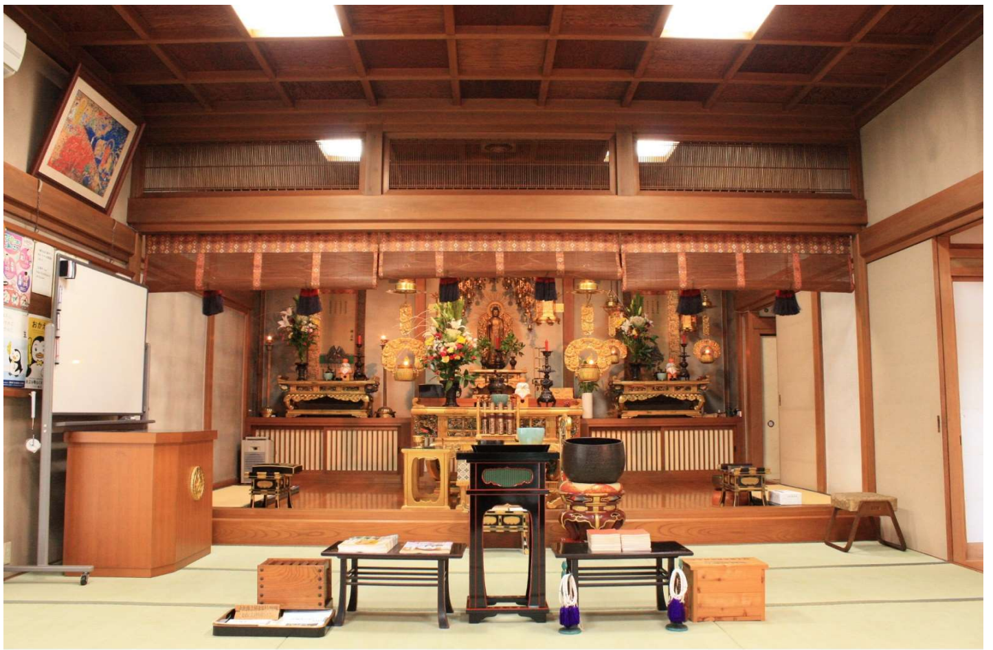
本堂【御法事等はこちらで勤めます】